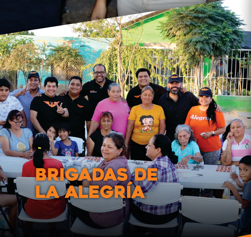
BRIGADAS DE LA ALEGRÍA