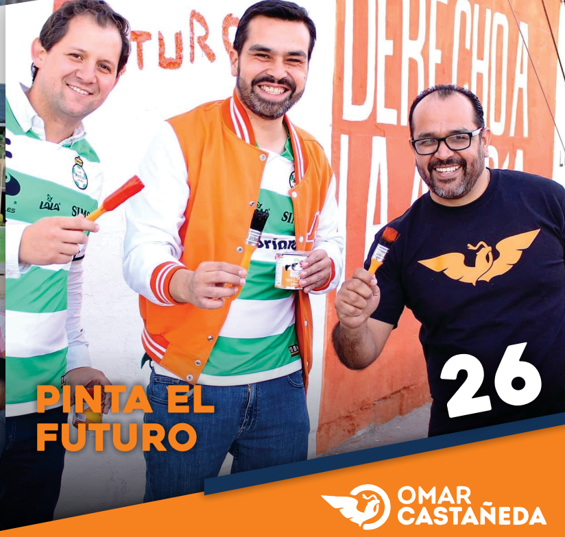
PINTA EL FUTURO